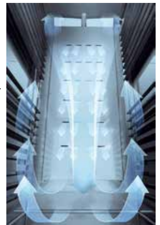
KSV 700 E 700 Liter Schränke mit vorgeformten Rostauflagen

feinfühlig abgestimmtes Rückwand-Luftleitsystem für eine gleichmäßige und sanfte Temperaturverteilung zur Schonung der Lebensmittel