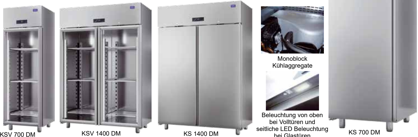
KSV 700 DM