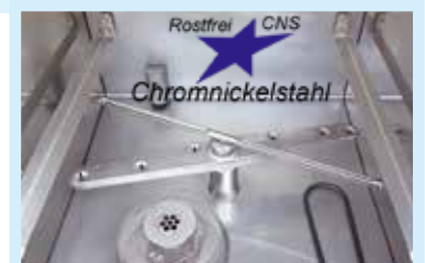
GLS 35B DW, GLS 40B DW