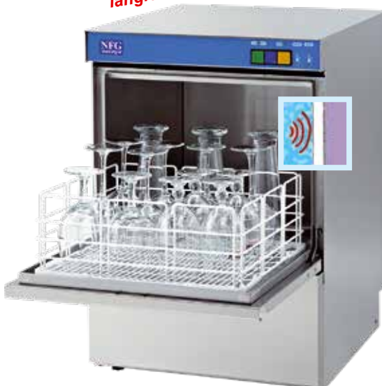
GLS 35B DW und GLS 40B DW mit „Elektromechanischer-Bedieneinheit“

Hochleistungsfähige, rostfreie und langlebige Edelstahl-Waschtechnik