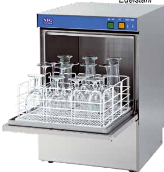
GLS 35B und GLS 40B mit „Elektromechanischer-Bedieneinheit“

Hochleistungsfähige, rostfreie und langlebige Edelstahl-Waschtechnik