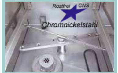
GLS 35B, GLS 40B

Hochleistungsfähige, rostfreie und langlebige Edelstahl-Waschtechnik