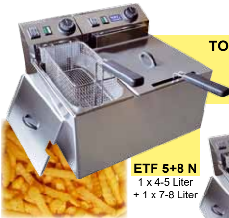
ETF 5+8 N 1 x 4-5 Liter + 1 x 7-8 Liter

TOP Qualität Komplett in rostfreiem Edelstahl, Kaltölzonen-Technik, Becken und Heizungselement sind für die Reinigung leicht zerlegbar TOP Leistung Tauchheizkörper, Temperatur 60 bis 190 °C, getrennt für jedes Becken, mit Korb und Deckel