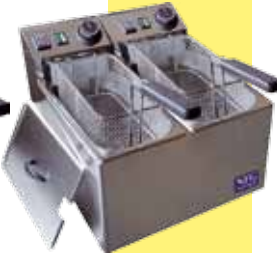
ETF 2x5 N 2 x 4-5 Liter