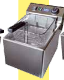
ETF 8 N 7-8 Liter