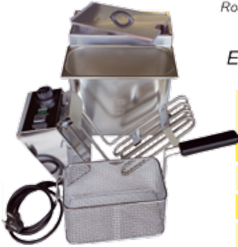
Kleinfriteuse zerlegt zur leichten Reinigung