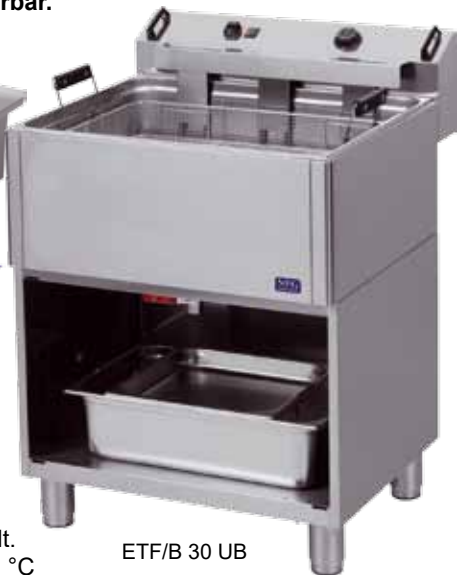
ETF/B 30 UB