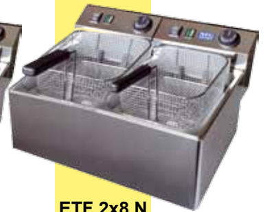
ETF 2x8 N 2 x 7-8 Liter