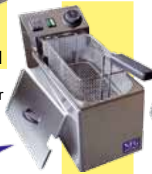
ETF 5 N 4-5 Liter