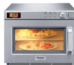
MW 2143-2 (mit Zwei-Etagen-Betrieb)