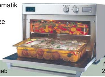
MW 1840, 2140, 3240