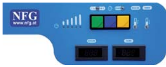
Bedienfeld DRS 50B ABL und DRS 50B DSP

Großradien abgerundete Ecken und leicht abnehmbare Filter für die schnelle, hygienische und einfache Reinigung