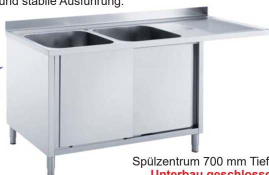
Spülzentrum 700 mm Tiefe, Unterbau geschlossen mit Flügelt- oder Schiebetüren

Ab 1600 mm Breite mit Schiebetüren unter 1600 mm mit Flügeltüren