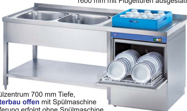
Spülzentrum 700 mm Tiefe, Unterbau offen mit Spülmaschine Lieferung erfolgt ohne Spülmaschine

Alle Spülzentren komplett aus Edelstahl, mit Aufkantung, verstellbare Füße, Grundboden, Standrohrventil (Überlaufrohr), Vorbereitung (Überstand) für Spülmaschinen Unterbau Breite 600 mm; Unterbau offen oder geschlossen mit doppelwandigen Flügel- oder Schiebetüren. Die geschlossenen Spülzentren sind ab 1600 mm Breite mit Schiebetüren und unter 1600 mm mit Flügeltüren ausgestattet. Hochwertig und stabile Ausführung.