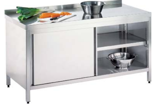
Arbeitsschrank 600 mm Tiefe mit Zwischenboden, Arbeitsplatte ohne Aufkantung hinten