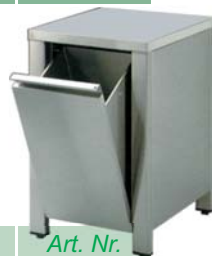
Abfallkipper mit Arbeitsplatte mit Aufkantung hinten