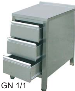
Arbeitsschrank mit 3 Schubladen GN 1/1 und Arbeitsplatte ohne Aufkantung hinten

Sondermaße und Sonderanfertigungen auf Anfrage!