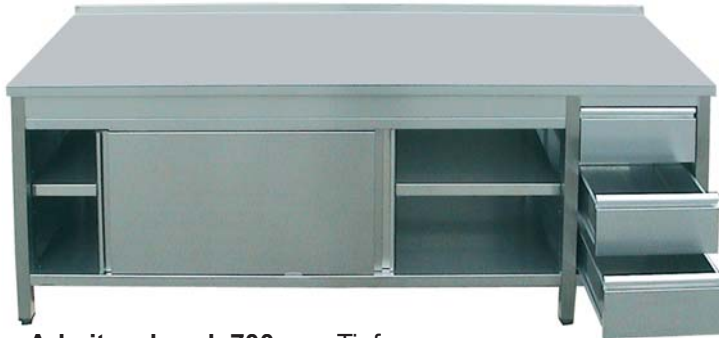
Arbeitsschrank 700 mm Tiefe, mit 3 Schubladen rechts , Schiebetüren, Zwischenboden und Arbeitsplatte ohne Aufkantung hinten

Alle Arbeitsschränke komplett aus Edelstahl, mit Schiebetüren und Schubladen (in Doppelwandausführung) sowie verstellbarem Zwischenboden. Edelstahl-Arbeitsfläche mit wasserabweisender und schalldämmter Unterplattenverstärkung für maximale Stabilität, Arbeitsplattenhöhe 40 mm, mit oder ohne Aufkantung, verstellbare Füße (Höhe 150 mm). Hochwertig und stabil verschweißte Ausführung.